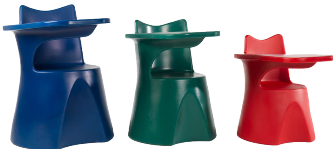
Tabla 8. Modelo del QDesk según el grado escolar